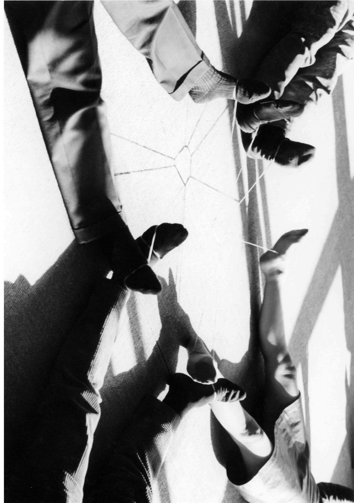
Lygia Clark, Structures vivantes, 1969.